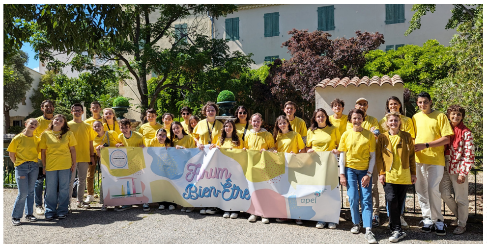
L'équipe des jeunes et leurs encadrants, devant les bâtiments du campus Fontlongue.

emparés du thème du bien-être en imaginant un forum fait pour et par les jeunes, qui réunirait tous les élèves du territoire. Avec une déclinaison en trois